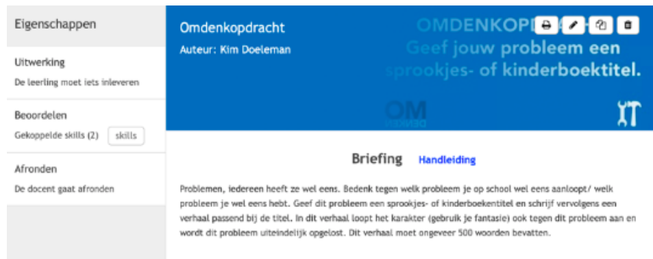
Figuur 4. Omdenkopdracht

Naast de gebruikelijke zaken als persoonlijke aandacht, goede werksfeer in de klas, eerlijk zijn en gelijkwaardigheid is het ook belangrijk dat leerlingen fouten mogen maken. Organiseer eens in de zoveel tijd 'het foute uurtje', waar leerlingen hun fouten mogen bespreken om daar vervolgens iets van te kunnen leren. Een mooi voorbeeld is omdenken. Docent Kim Doeleman van het Montaigne Lyceum maakte daarvoor deze opdracht [figuur 4].